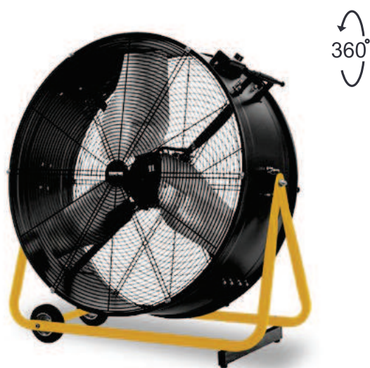
DF 30 DF 36